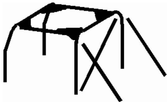
Principe 2 avec les goussets dans les angles

Les commissaires techniques devront vérifier que le pilote et copilote du véhicule, assis dans les sièges, soient protégés par l'arceau en cas de tonneau.